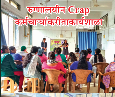
रुग्णालयीन Crap कर्मचाऱ्यांकरीता कार्यशाळा