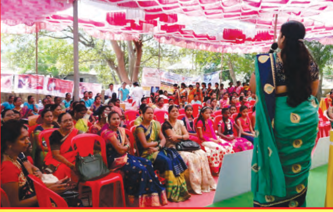
महिला मेळाव्यात मार्गदर्शन