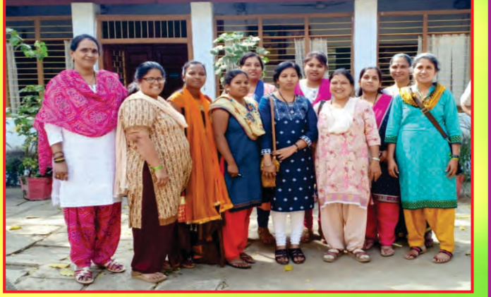
राजपिपला सोशल सर्विस सोसायटी, गुजरात अभ्यास दौरा