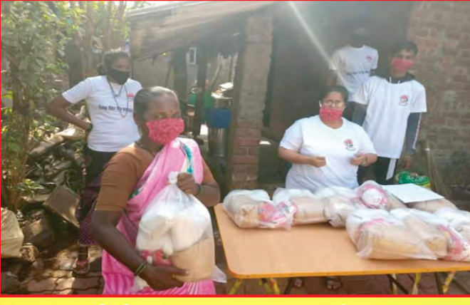
वस्तीतील गरजूंना अन्नधान्याचे वाटप