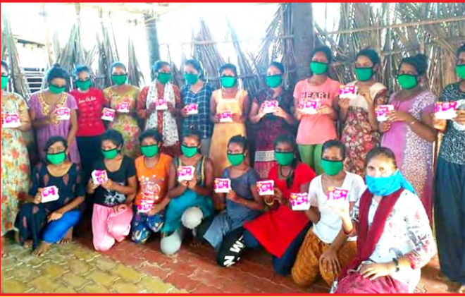
वस्तीतील किशोरवयीन मुलींना सॅनिटरीपॅडचे वाटप